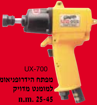
UX-700 מפתח הידרופניאומטי 3/8" למומנט מדויק n.m. 25-45 משקל: 1.38 ק"ג נ"ש 5940