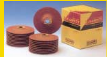
RESIBON אבן השחזה 4" מורידה בקלות נירוסטה אינה נסתמת באלומיניום נ"ש 15