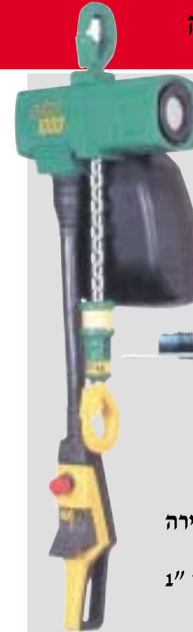
J.D.N. כננת פניאומטית להרמת 250 ק"ג מוגנת פיצוץ בתקן משקל: 10.5 ק"ג אורך שרשרת: 3 מ' תוצרת גרמניה נ"ש 8900