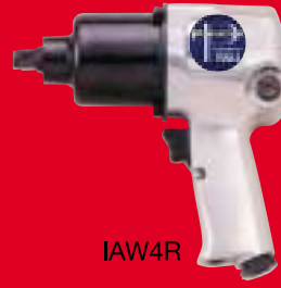
IAW4R מפתח ברגים 1/2" (תואם אינגרסול) 2.6 ק"ג, מומנט 550 n.m. נ"ש 580