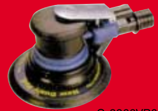
C-3366VP6 מלטשת 6" תעשיתית משקל 0.8 ק"ג הקלה בעולם חזקה במיוחד כולל מתאם לשואב אבק