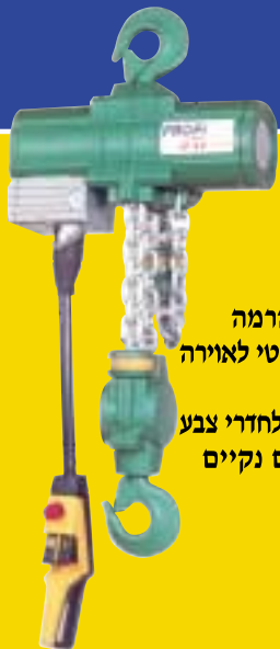
מנוף הרמה פניאומטי לאוירה נפיצה מיוחד לחדרי צבע וחדרים נקיים