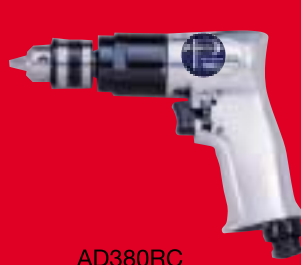
AD380RC מקדחה שמאל ימין לפוט 10 מ"מ (3/8") מהירות 2000 סל"ד נ"ש 330