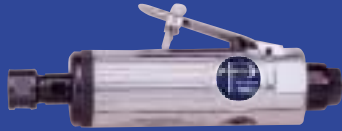
NAT-4002 משחזת ציר (קולט 6 מ"מ או 1/4") מהירות 22,000 סל"ד משקל 0.6 ק"ג נ"ש 160