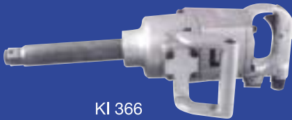
KI 366 מפתח 1" ציר ארוך למשאיות מומנט 2033 n.m. משקל 11.3 ק"ג נ"ש 3322