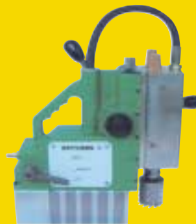
מקדחה מגנטית פניאומטית לאוירה נפיצה לקידוח קוטר עד 2-1/16" לעומק עד 2-1/16"