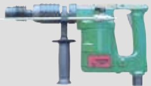
ROTARY HAMMER פטישון פניאומטי לאוירה נפיצה עם פוטר SDS לקידוח בבטון עד קוטר 1" משקל: 5.3 ק"ג