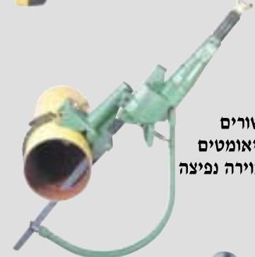
משורים פניאומטיים לאוירה נפיצה